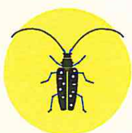
THE ASIAN LONGHORN BEETLE ( Anoplophora glabripennis )

Preventing the introduction into and spread of organisms which are harmful to plants or plant products within the EU are among the principle objectives of EU plant health legislation.