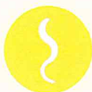
PINEWOOD NEMATODE ( Bursaphelenchus xylophilus )

Specific rules are in place for 52 commodities imported from China and Belarus with wood packaging material under Decision 2018/1137/EU as they present an increased phytosanitary risk. This Decision prescribes that at least 1% of the incoming consignments and their wood packaging are checked.