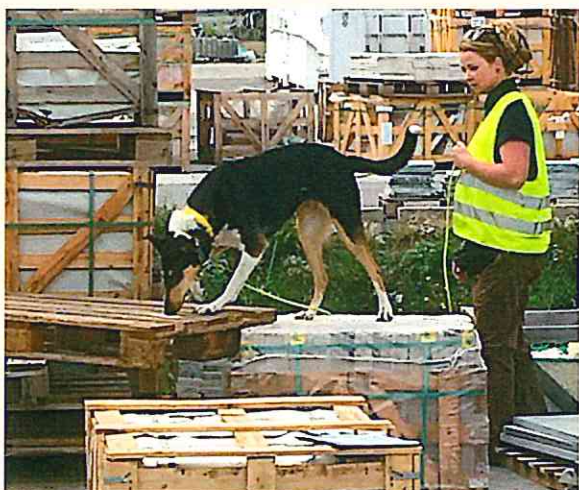
Sniffer dog searching for insects

Preventing the introduction into and spread of organisms which are harmful to plants or plant products within the EU are among the principle objectives of EU plant health legislation.