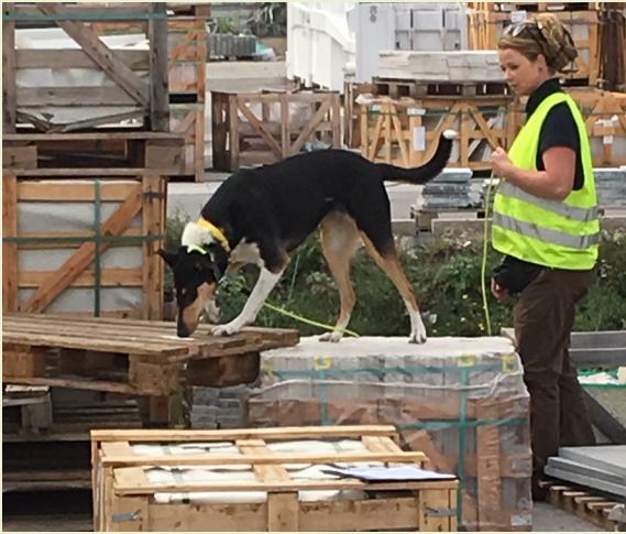
Sniffer dog searching for insects

Preventing the introduction into and spread of organisms which are harmful to plants or plant products within the EU are among the principle objectives of EU plant health legislation .