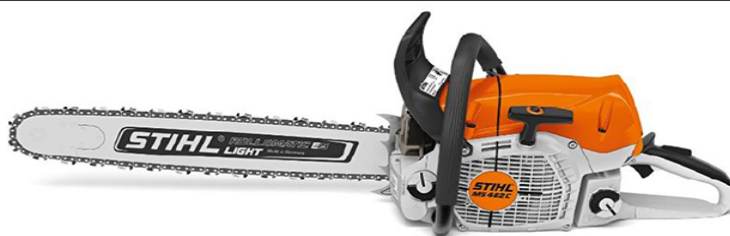
Bild: Motorsäge STIHL MS 462

Περισσότερες πληροφορίες για τα πιο πάνω προϊόντα είναι καταχωρημένες στην ιστοσελίδα του RAPEX.