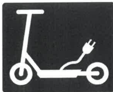
Σήμανση Οδοστρώματος Β

Επιτρεπόμενος χώρος διακίνησης Συσκευών Προσωπικής Κινητικότητας σε οποιαδήποτε πλατεία ή σε οποιοδήποτε πεζόδρομο.