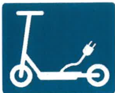
Σήμανση Οδοστρώματος Α