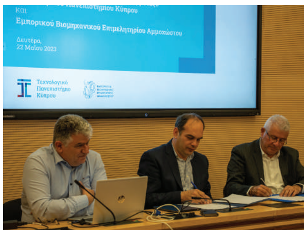
Τελετή υπογραφής ανανέωσης πρωτοκόλλου συνεργασίας ΤΕΠΑΚ - ΕΒΕ Αμ/στου

Πέρα των πιο πάνω, όπως και στα προηγούμενα χρόνια, έτσι και το 2022, τα τοπικά ΕΒΕ συνέχισαν να συμβάλλουν στη διαμόρφωση της πολιτικής του ΚΕΒΕ για θέματα παγκύριου ενδιαφέροντος, μέσα από τη συμμετοχή τους σε συλλογικά όργανα του κεντρικού Επιμελητηρίου, Επιτροπές, Διοικητικό Συμβούλιο και Εκτελεστική Επιτροπή.