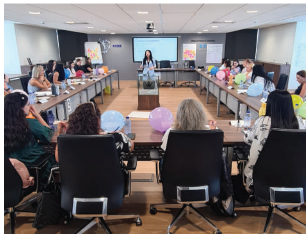
Σεμινάριο Βασικές Δεξιότητες και Εργαλεία για το προσωπικό

Το ΚΕΒΕ εκπροσωπείται στα Συμβούλια του Ταμείου Πλεονάζοντος Προσωπικού και της Προστασίας των Δικαιωμάτων των Εργοδοτούμενων σε περίπτωση αφερεγγυότητας του εργοδότη τα οποία ασχολήθηκαν με τις οικονομικές καταστάσεις και τους λογαριασμούς των δύο ταμείων για το 2022.