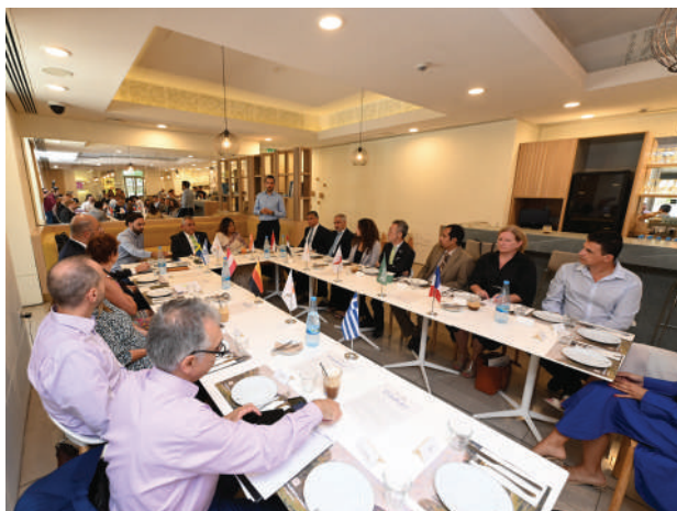
Business meets Diplomacy: Breakfast with Ambassadors