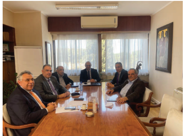
Συνάντηση με τον Υπουργό Εργασίας και Κοινωνικών Ασφαλίσεων

Ενόψει των πιο πάνω ο Υπουργός Εργασίας και Κοινωνικών