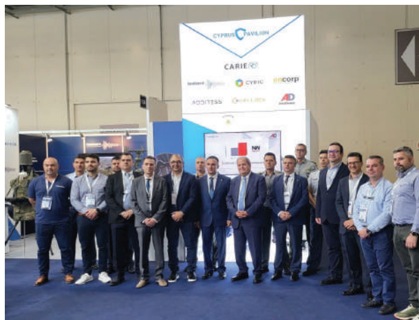
Συμμετοχή στην έκθεση Αμυντικής Βιομηχανίας DEFEA

Ο Συνασπισμός Μικρών Επιχειρήσεων & Αυτοεργοδοτούμενων (ΣΥ.Μ.Ε.Α) εντάχθηκε κάτω από την ομπρέλα του ΚΕΒΕ το 2022. Κατά τα τελευταία 2 έτη πραγματοποίησε σειρά συναντήσεων με όλα τα χρηματοπιστωτικά ιδρύματα της χώρας όπως την Τράπεζα Κύπρου, ΚΕΔΙΠΕΣ, Alpha Bank, CDB Bank και διερεύνησε προοπτικές συνεργασίας για τα μέλη του.