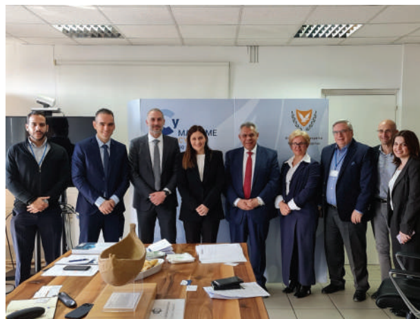
Συνάντηση με την Υφυπουργό Ναυτιλίας