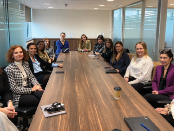
Συνάντηση Δικτύου Γυναικών ICC Κύπρου