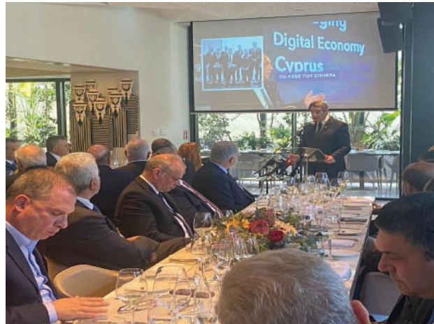
Γεύμα προς τιμή του τεως ΠτΔ κ. Νίκου Αναστασιάδη

Παρακολουθούμε την εξέλιξη των δεδομένων και ευελπιστούμε ότι θα δούμε στο άμεσο μέλλον πρακτικά μέτρα και αποφάσεις για επίλυση αυτών των θεμάτων. Ήδη κάποιες αποφάσεις έχουν