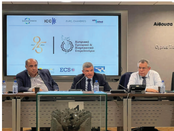
Ο Υπουργός Ενέργειας, Εμπορίου και Βιομηχανίας στο ΔΣ του ΚΕΒΕ

Το 2023 τροποποιήθηκε η νομοθεσία, περί Ακίνητης Ιδιοκτησίας (Διακατοχή, Εγγραφή και Εκτίμηση) Νόμου που αφορά τις βιομηχανικές περιοχές. Πιο συγκεκριμένα έχει γίνει τροποποίηση για διεύρυνση των επιτρεπόμενων χρήσεων, ώστε να επιτρέπεται η εγκατάσταση μονάδων που ασχολούνται με την παραγωγή, τη μετάδοση και τη διανομή ηλεκτρικής ενέργειας, την παραγωγή