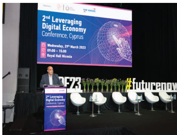
2nd Leveraging Digital Economy Conference

Στο πλαίσιο της συνεχούς προσπάθειας που καταβάλλεται για αναβάθμιση των ποιοτικών υπηρεσιών που παρέχει το ΚΕΒΕ προς τις επιχειρήσεις, ο Οργανισμός παρέχει τη δυνατότητα για