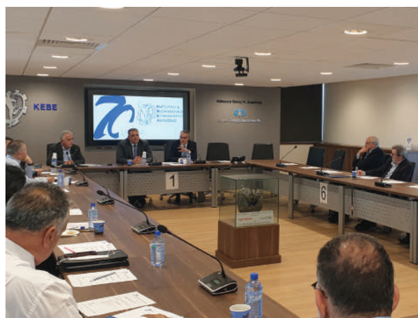
Συνάντηση ΔΣ ΕΒΕ Λευκωσίας με το Διοικητή της Κεντρικής Τράπεζας