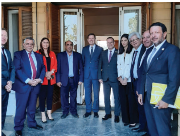
Τριμερή συνάντηση ΚΕΒΕ ΟΗΕ και ΚΤΤΟ

με πολύ γοργά βήματα και διατρέχουμε τον κίνδυνο να μας ξεπεράσουν αν δεν εγκαταλείψουμε παλιές νοοτροπίες και δεν ενεργήσουμε γρήγορα.