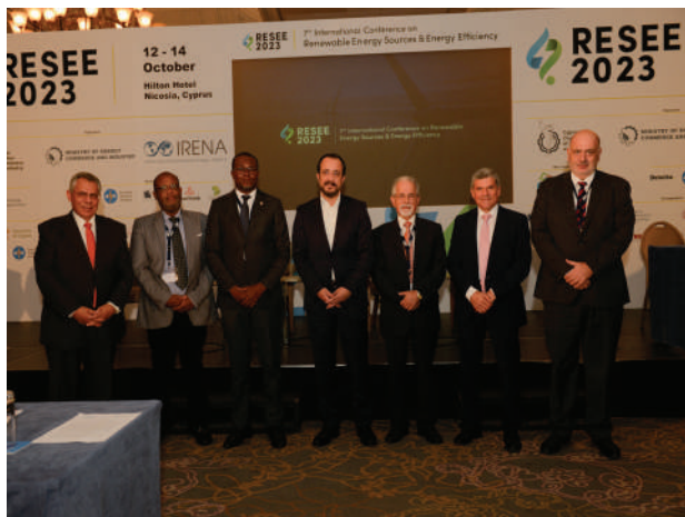
7 ο Διεθνές Επιστημονικό Συνέδριο Ανανεώσιμων Πηγών Ενέργειας και Εξοικονόμησης Ενέργειας

κανονισμών που διέπουν τη σήμανση νωπών οπωροκηπευτικών γεωργικών προϊόντων κατά την οποία οι συμμετέχοντες είχαν την ευκαιρία να υποβάλουν απορίες προς τους λειτουργούς του Κλάδου Φυτοϋγείας και Εμπορικών Προδιαγραφών Γεωργικών Προϊόντων.