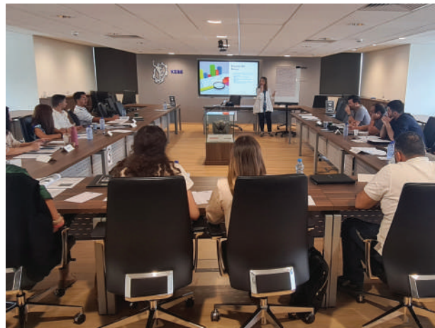
Σεμινάριο Ζωτικής Σημασίας «From Metrics to Action: Using Analytics to Drive Strategic and HR Decisions»

Αυτό το σεμινάριο ήταν το τελευταίο από τα τρία σεμινάρια υψηλού επιπέδου που είχαν πραγματοποιηθεί προηγουμένως και είχε στόχο την παρουσίαση και συζήτηση των ευρημάτων