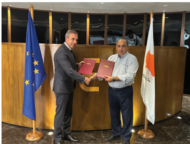
Υπογραφή μνημονίου Συναντίληψης ΚΕΒΕ - ΑΨΑ

καθορισθεί με βάση τους στρατηγικούς στόχους της Λισσαβόνας και τη διαδικασία της Μπολόνια, που προνοεί τη δημιουργία ενός ευρωπαϊκού χώρου ανώτερης εκπαίδευσης.