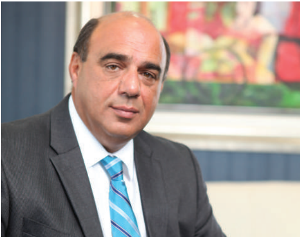
Ο Πρόεδρος του ΚΕΒΕ κ. Χριστόδουλος Ε. Αγκαστινιώτης