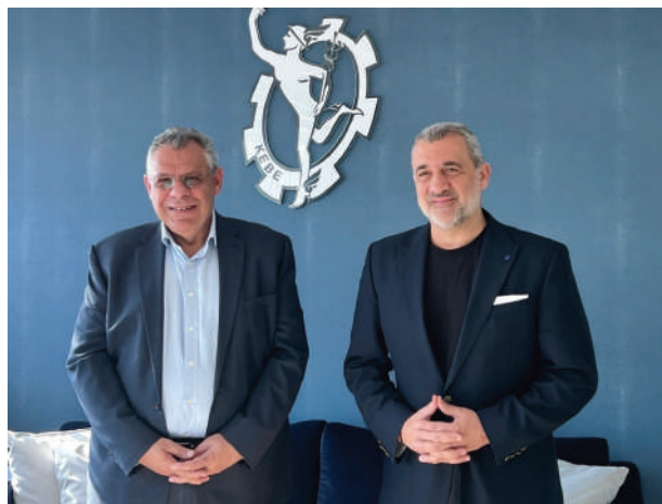
Συνάντηση με τον Ευρωβουλευτή κ. Λουκά Φουρλά

Το ΚΕΒΕ κατάθεσε σωρεία απόψεων και εισηγήσεων για τροποποιήσεις σε προτεινόμενα νομοθετήματα που άμεσα ή έμμεσα επηρεάζουν τον επιχειρηματικό κόσμο και ενημέρωσε τη Βουλή για συγκεκριμένα προβλήματα που αντιμετωπίζουν τα μέλη του. Εκτός των διαφόρων νομοθετημάτων και Κανονισμών, εκπρόσωποι του Επιμελητηρίου και των Επαγγελματικών Συνδέσμων κατάθεσαν απόψεις για θέματα όπως την ανάγκη λήψης προστατευτικών μέτρων για τους καταναλωτές και τις επιχειρήσεις από την πρόσφατη αύξηση των δανειστικών επιτοκίων, την εγκατάσταση και