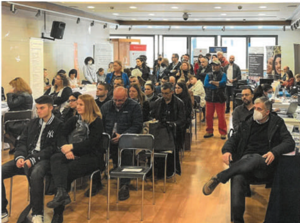
Προβολή της Ανώτερης Εκπαίδευσης της Κύπρου στην Κρήτη και Αθήνα

Κύπρου θα προσελκυστούν σκάφη αναψυχής από το εξωτερικό, καθιστώντας την Κύπρο ελκυστικό Ναυτικό προορισμό.