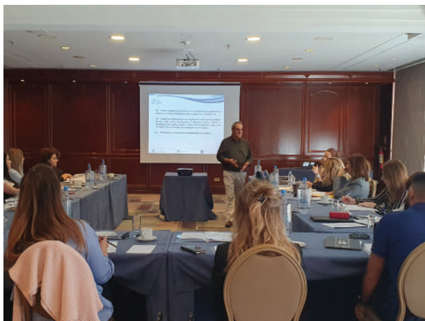
Σεμινάριο Τερματισμός Απασχόλησης και Προστασία των Μισθών

Το ECDL λειτουργεί σε 148 χώρες και προσφέρεται σε 41 γλώσσες, συμβάλλοντας έμπρακτα στην απρόσκοπτη διακίνηση του προσωπικού από χώρα σε χώρα με διεθνώς αναγνωρισμένα προσόντα. Αναγνωρίζεται από κυβερνήσεις και διεθνείς οργανισμούς, οργανισμούς και επιχειρήσεις του δημόσιου και ιδιωτικού τομέα, καθώς και μη κυβερνητικούς οργανισμούς, ως το κατ' εξοχήν αξιόπιστο εργαλείο πιστοποίησης ψηφιακών δεξιοτήτων διεθνώς.