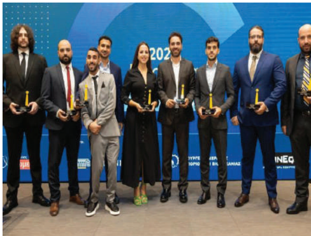
Βραβεία ΓΕ' ΝΕΟ ΕΠΙΧΕΙΡΕΙΝ

Το ΚΕΒΕ διοργάνωσε για 4η συνεχόμενη χρονιά τα «Cyprus Diplomat of the Year Awards», με στόχο την επιβράβευση των ξένων Διπλωματικών Αποστολών που είναι διαπιστευμένες στην