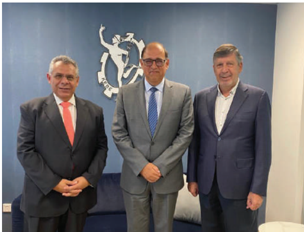
Εθιμοτυπική συνάντηση με τον Πρόεδρο του Μεξικού

Πρωταρχικός στόχος ήταν η ενημέρωση του επιχειρηματικού