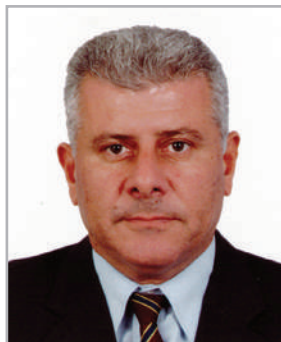
Πρόεδρος: Αυγουστίνος Παπαθωμάς