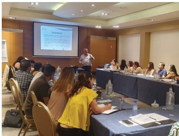
Σεμινάριο Εφαρμογή Σημαντικών Εργατικών Νομοθεσιών