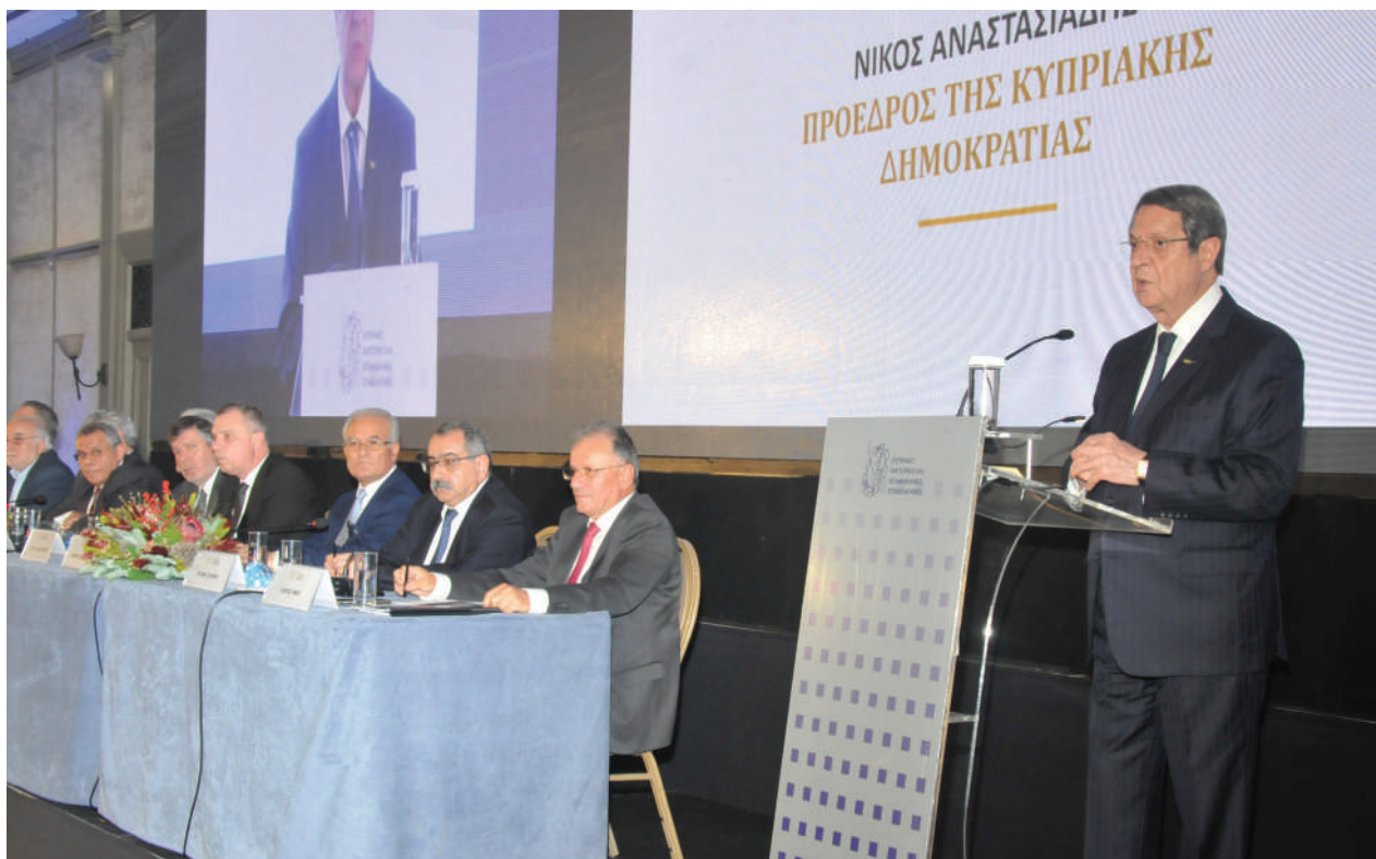
Στιγμιότυπο από την περσινή Ετήσια Γενική Συνέλευση