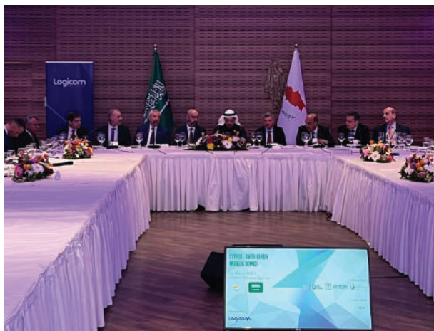
Δείνo εργασίας Κύπρου - Σαουδικής Αραβίας

Στις συνεδριάσεις και ανάλογα με τα θέματα που συζητούνται, καλούνται εκπρόσωποι από άλλους Συνδέσμους και