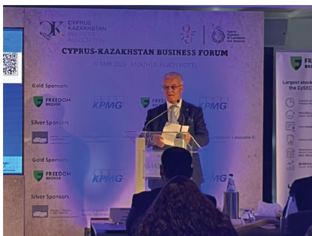
Επιχειρηματικό Συνέδριο Κύπρου - Καζακστάν

συστηματικά τα θέματα της Οικονομικής Διπλωματίας. Στην υπό αναφορά περίοδο δημιουργήθηκαν δύο νέοι επιχειρηματικοί σύνδεσμοι, Κύπρου - Καμπότζης και Κύπρου - Μάλτας.