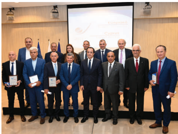
Τελετή Απονομής Βραβείων Εξαγωγών