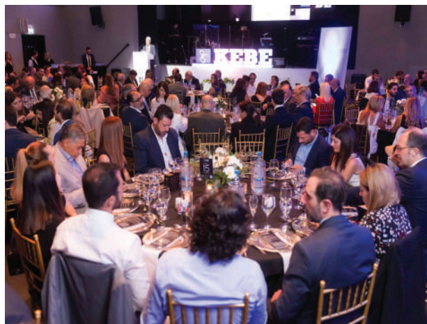
Επίσημο φιλανθρωπικό δείπνο - 95χρόνια ΚΕΒΕ

Όσον αφορά την κυπριακή οικονομία, το 2023 ο ρυθμός ανάπτυξης αναμένεται να κυμανθεί γύρω στο 2.4% σε σύγκριση με 5.1% το 2022. Το ΑΕΠ της χώρας έφθασε στα €27.7δισ σε τρέχουσες τιμές για το 2022 σε σύγκριση με €25.0δισ το 2021, αύξηση 11.4%. Η ανάπτυξη οφείλεται κυρίως στους τομείς των ξενοδοχείων και εστιατορίων, ενημέρωσης και επικοινωνίας, χονδρικό και λιανικό εμπόριο, μεταφορά και αποθήκευση.