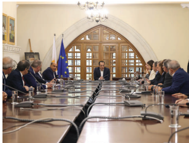
Συνάντηση ΕΕ του ΚΕΒΕ με τον Πρόεδρο της Δημοκρατίας