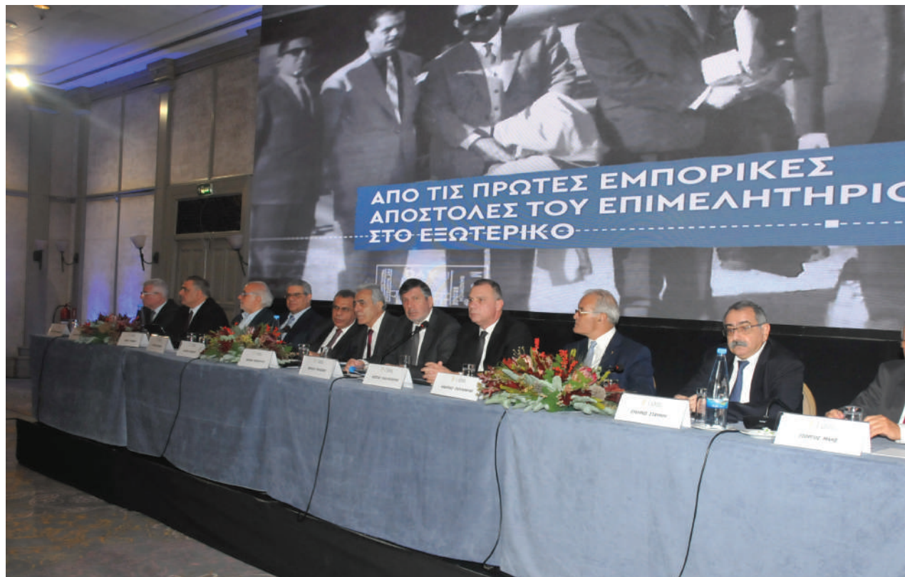
Στιγμιότυπα από την Ετήσια Γενική Συνέλευση