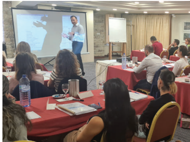
Σεμινάριο "Επεξήγηση Βασικών Κανόνων IFRS"

Το ΚΕΒΕ, αντιλαμβανόμενο την τεράστια σημασία που πρέπει να αποδίδουν οι επιχειρήσεις στα θέματα ασφάλειας και υγείας στην εργασία, διοργάνωσε δύο ακόμη σεμινάρια. Το πρώτο αφορούσε την εξειδικευμένη εκπαίδευση στη διαχείριση