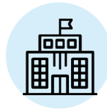
Εργασίες γραφείου – Σχολικές μονάδες