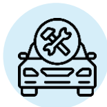
Επισκευές και βαφές οχημάτων